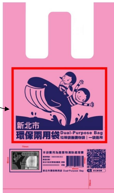
圖例 各合作對象可自行設計環保兩用袋樣式