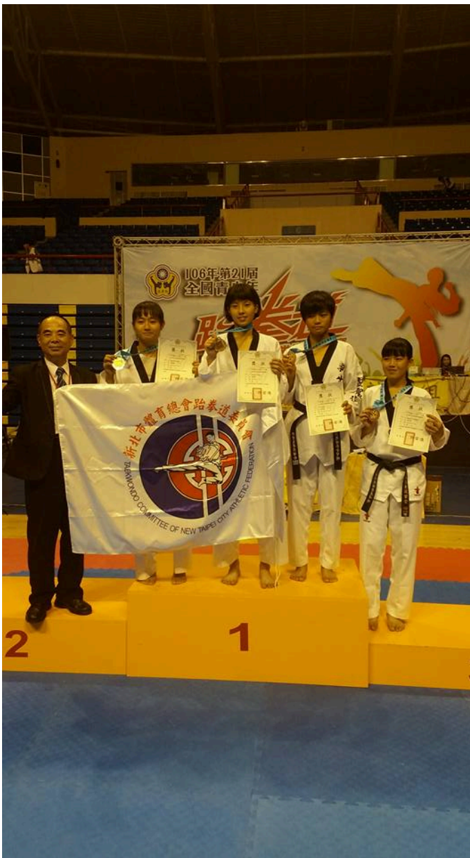
照片說明:頒獎照(二)