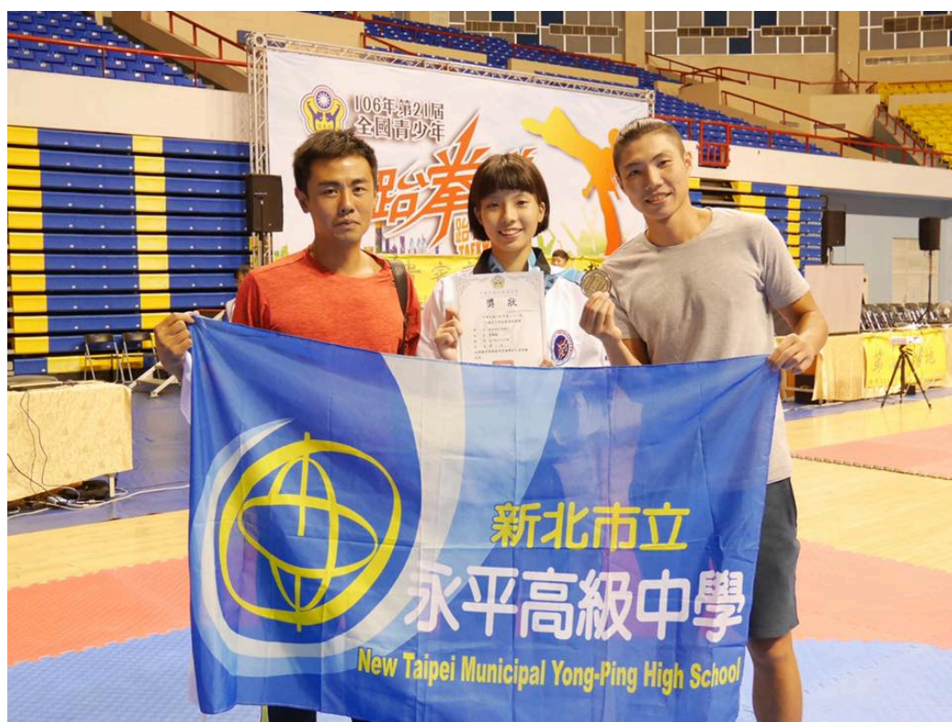
照片說明:頒獎照(一)