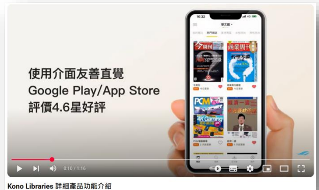
▲ KONO Libraries 電子雜誌特色影片