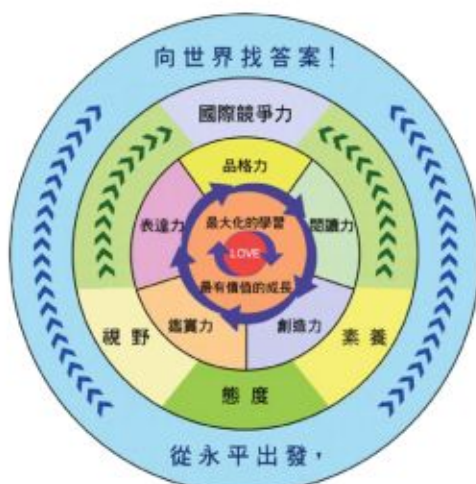
永平高中學校願景