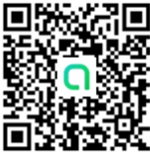
活動 Line 社群 QR code

敬請加入學會競賽 Line 社群： https://reurl.cc/NpGqK6