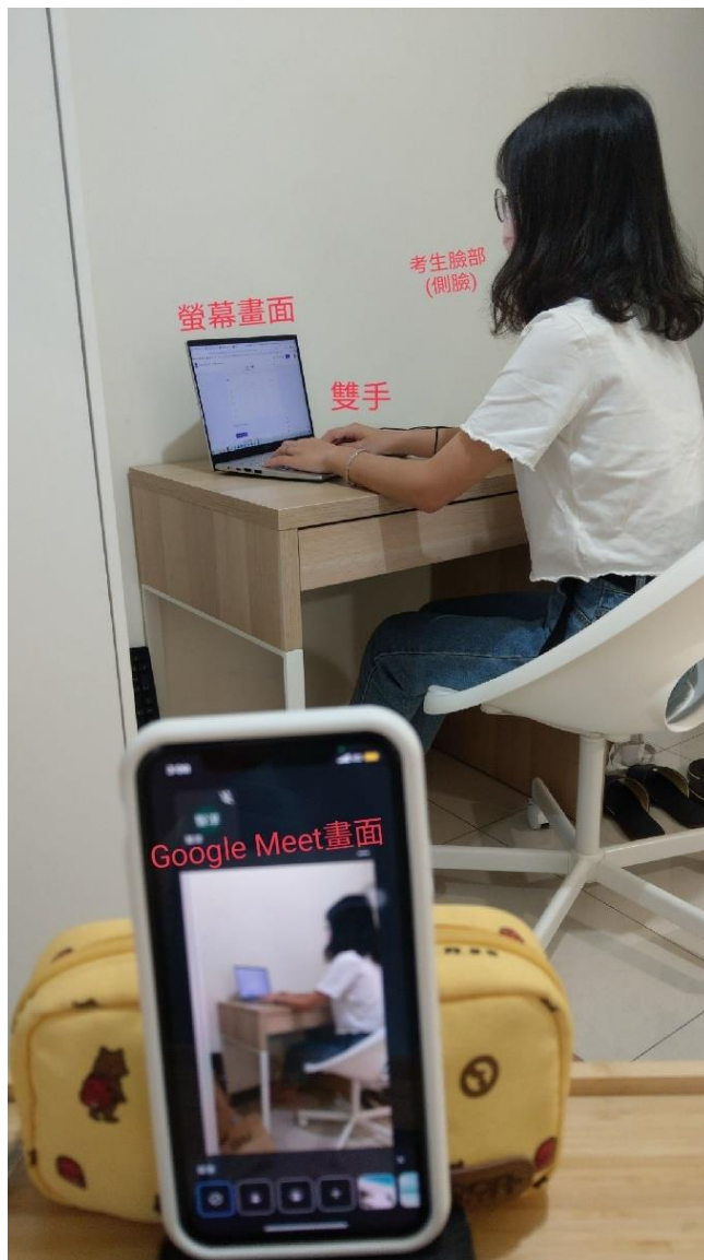
圖三、以手機呈現應試環境於 google meet 線上監考網址