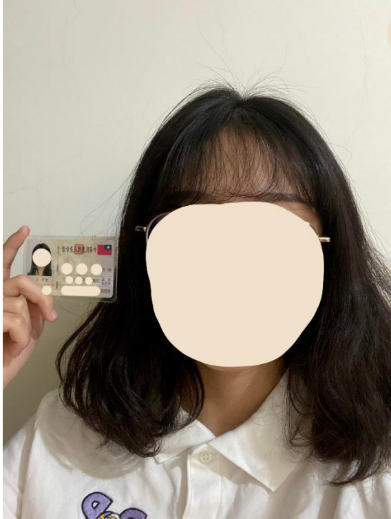
圖四、身份驗證畫面示意圖