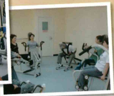
▲延緩失能運動中心