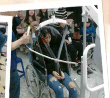
▲多元技能培訓活動