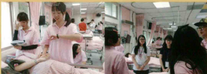
▲ 長期照護技術教室

本系具備優質的教學環境、設備與多元實習場所，且為勞動部照顧服務員課程訓練及產業人才投資計畫之訓練場地。專業教室如下：(接續背面)