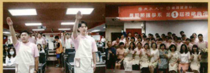
▲ 全國首創授裙典禮