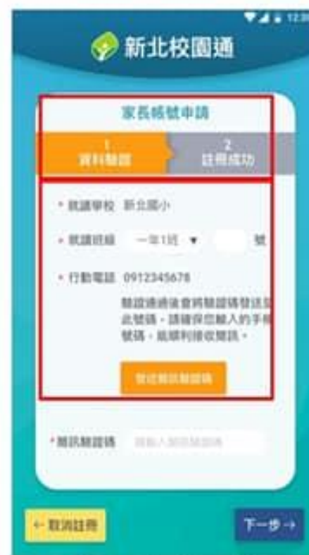
3. 雙重資料驗證 (子女資料比對、手機號碼簡訊驗證)