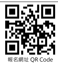
報名網址 QR Code

捷運淡水站，轉乘紅 37、860、862、863、865、867、872、823、874、881、892 公車至「淡