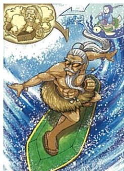
一般組(1頁漫畫)「東山再起」 作品名:TARO URASHIMA 筆名:Kitaoka Mitsuru (日本)