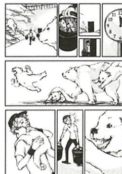
一般組(故事漫畫)主題自訂 作品名:You are my best gift 筆名:Akimichi(俄羅斯)