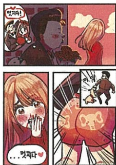
高中組「真棒！」 作品名:帥氣內褲 筆名:遊人(韓國)