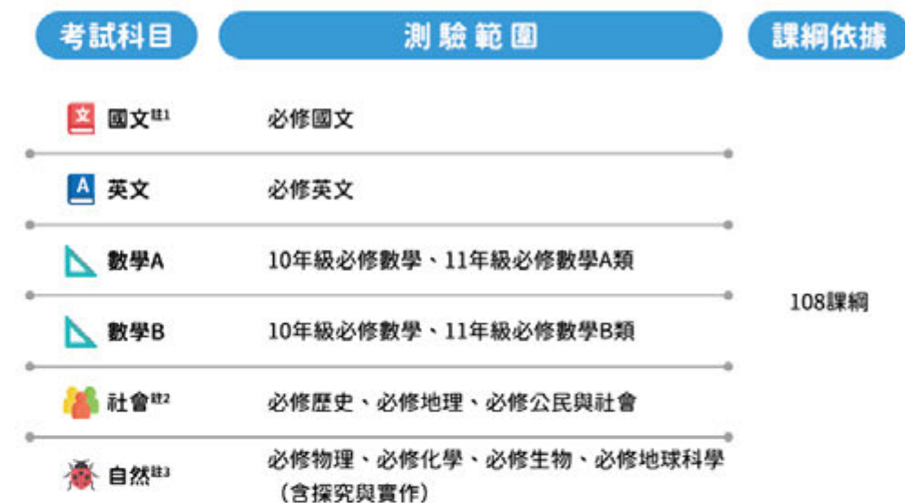
表一、學科能力測驗的測驗範圍