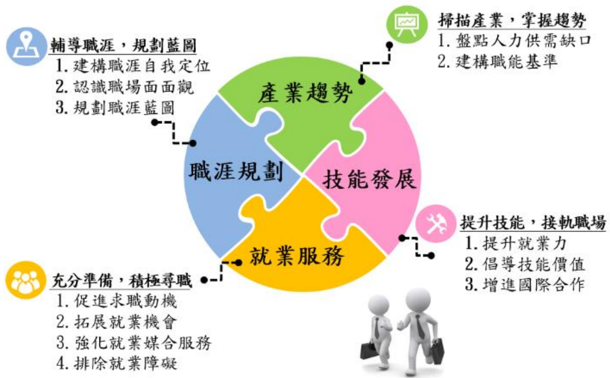
圖 1 投資青年就業方案策略圖