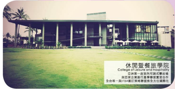
休閒暨餐旅學院 College of Leisure and Hospitality 亞洲第一座室內可調式攀岩場 與百餘家企業進行產學學業實習合作 全台灣唯一與IFBA簽訂策略聯盟推全方位國際化