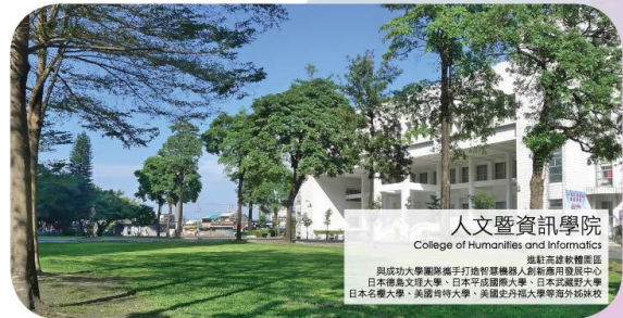
人文暨資訊學院 College of Humanities and Informatics 高雄高教輔高區 與成功大學聯誼會王地管理機轉入新創應用發展中心 日本德島文理大學、日本經濟大學、日本武藏野大學 日本名城大學、美國福特大學、美國史內福大學等海外姊妹校