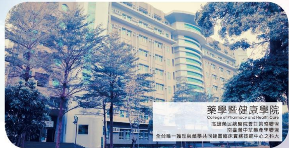
藥學暨健康學院 College of Pharmacy and Health Care 高雄榮民總醫院醫事管理學系 高雄榮民總醫院護理學系 全台灣唯一護理與藥劑共同建置臨床實務技術中心之科大