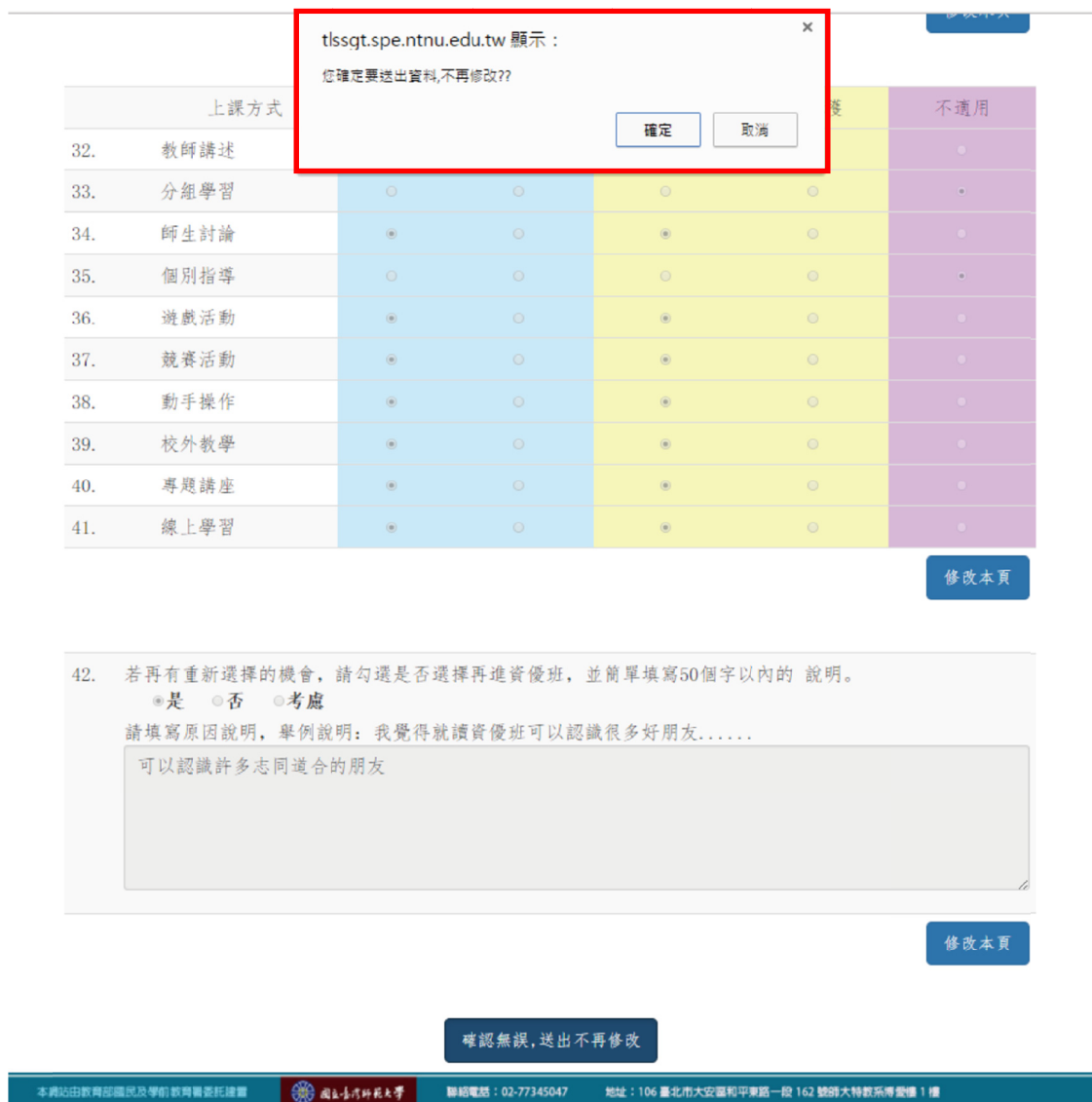
圖 23 再次確認無誤頁面