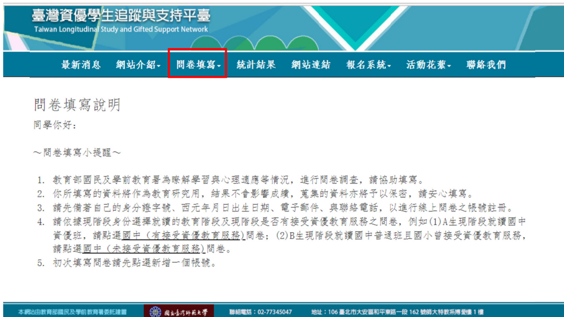
圖 2 問卷填寫