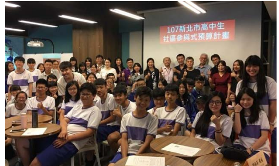
參與式計畫提案實體發表會