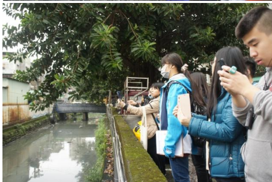
野外考察、實地觀測，行動載具輔助