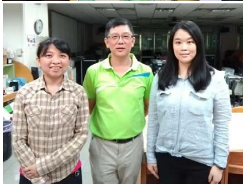
跨領域教師 PLC，協同設計課程