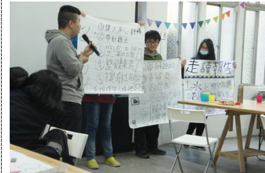
小導遊點位解說、創意提案