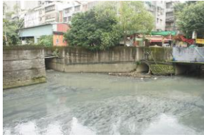
圖三：中游的雙江口水質汙染

3.與居民的關係遠離：目前功能主要為排廢水及防洪，河岸多以植栽、護欄或水泥牆隔絕，河濱也充滿雜草、碎石、垃圾，多數人視它為髒臭的大水溝，在生活中多是路過而沒有多加關心和了解的意願。