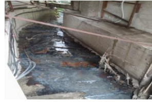
圖四：北支流源頭水源不足