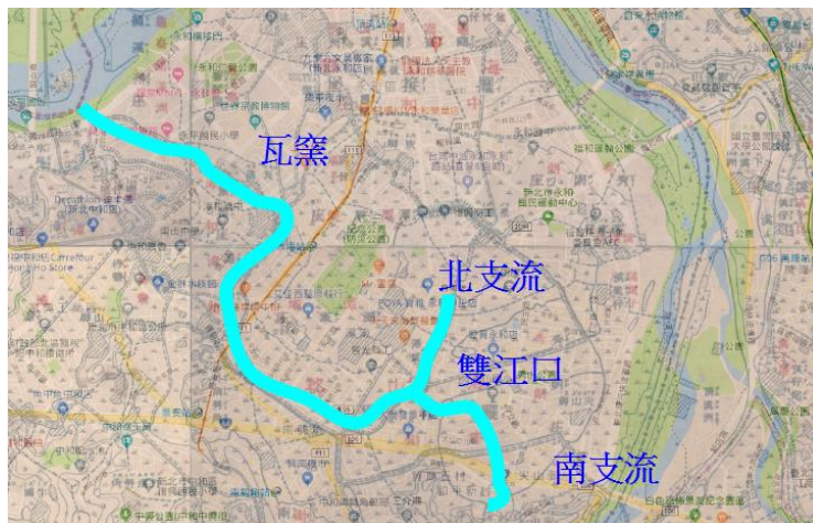
圖二：瓦礫溝流域古今地景變遷疊圖比較

瓦礫溝由北起潭墘（今日復興美工）的北支流，以及南起尖山（今日秀朗橋附近）的南支流匯聚而成，流經中永和地區，最後在新瓦礫溝抽水站流入新店溪，全長約 5 公里，流域面積約 5 平方公里，僅屬於三級河的小型河川（林文生，2018）。瓦礫溝在不同時期的命名有所不同，瓦礫溝以前又名為潭墘溝，「墘」是邊，而「溝」是盆地內的小水溝，戰後改名為瓦礫溝，因昔日中和瓦礫里地區曾設礱燒製磚瓦而得名，而且瓦礫溝在早期主要是負責排水，也常用來運送物資，下游還有渡口可以停泊通行小船（許明正等，2014）。如今，因為都市化而使水量減少的瓦礫溝，已失去昔日航運及農業排水的功能，再加上汙染的排入讓河道更顯髒汙，以及為了降低洪患風險，政府也將其整治成水泥排水溝，產生的生態及環境破壞是不可被忽略，以上這些變化，都使得瓦礫溝漸漸被住戶忽視與遺忘。