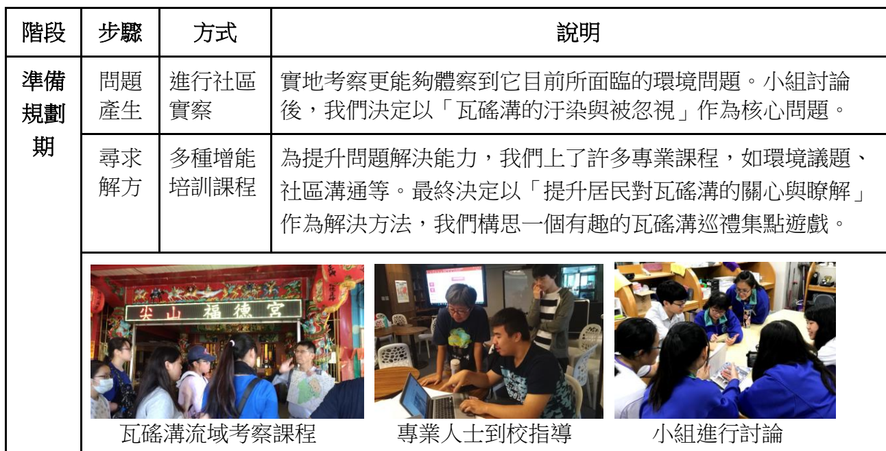
表一：瓦礫溝參與式計畫的社區參與執行流程

我們的目標是希望能夠喚醒瓦礫溝附近居民的社區意識，讓他們對瓦礫溝有更多關心、更深入認識，並瞭解到環境保護的重要。參考劉慧月、李長河（2013）的社區參與步驟，進行瓦礫溝參與式計畫的內容規劃，如下表整理：